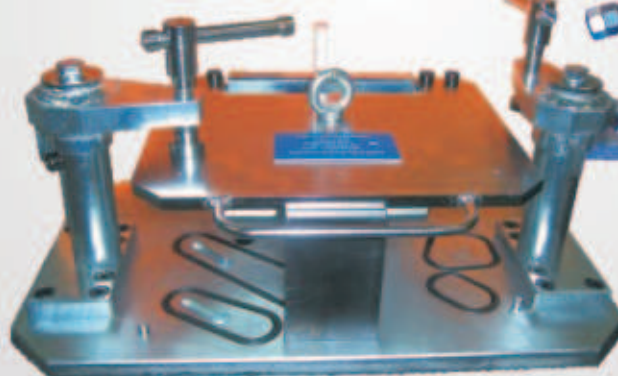
VÍZ ALATTI NYOMÁSPRÓBA KÉSZÜLÉK